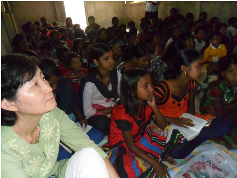
(사진 4 Good News Club)

제자들을 40 개 전도팀으로 묶어서 12 월 한달동안 200 개 마을 만명 이상의 새로운 아이들에게 성탄절 파티전도를 통해 복음을 전할려고 합니다.