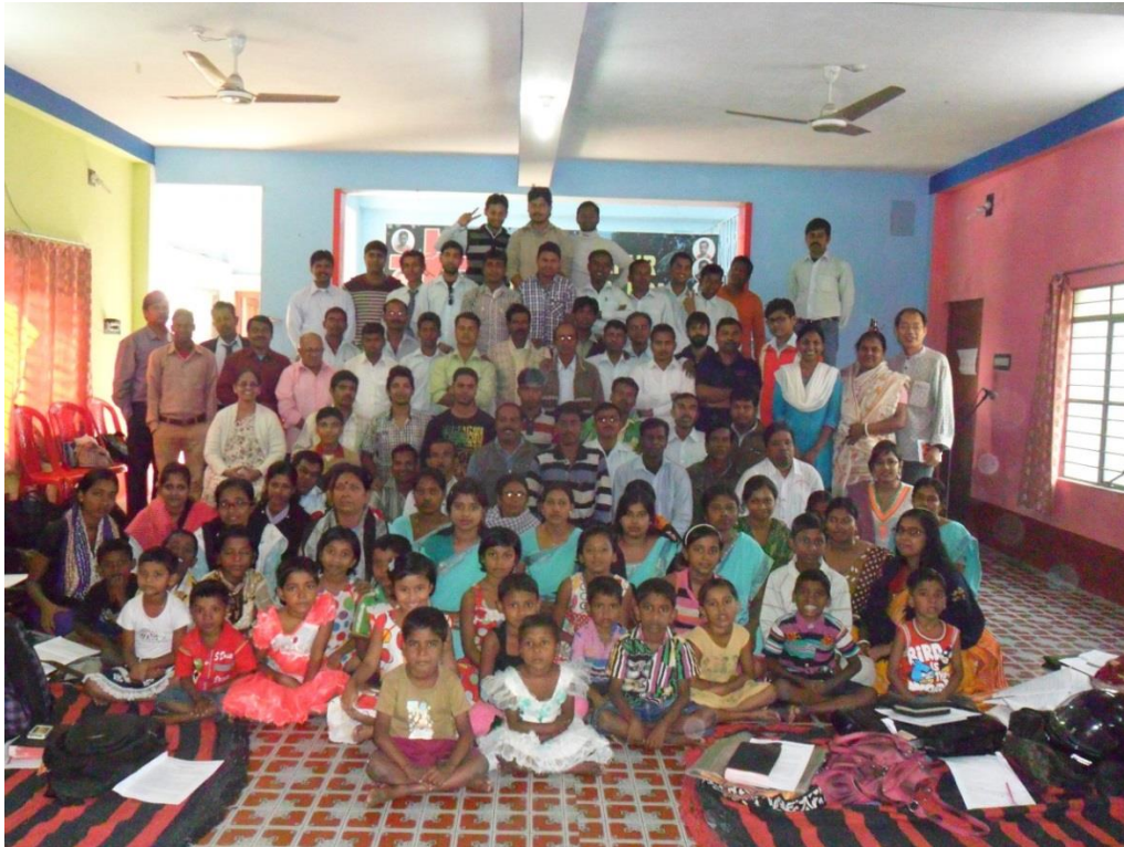
(사진 3 Group picture of Lifeline)

올해를 돌아보고 내년을 위해 전도세미나를 마치고 라이프라인 전체의 사진을 찍었습니다. 이 사진으로 한장짜리 전도달력을 만들려고 합니다.